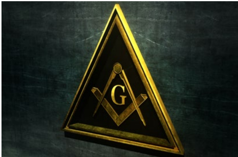
4. Litera G w symbolice masońskiej