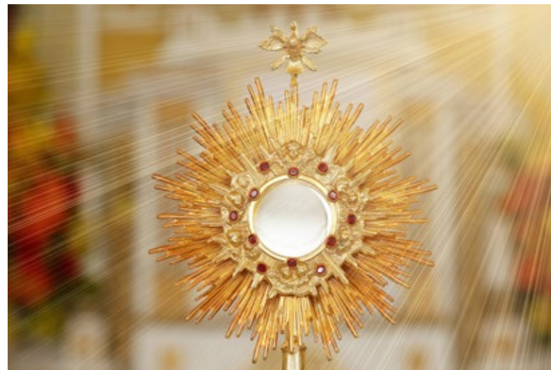
1. Monstrancja – krótkimi i długimi promieniami słońca