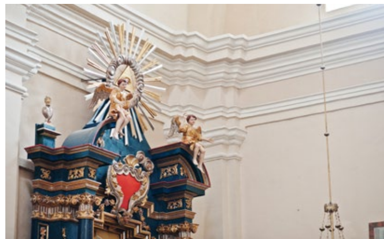
2. Wszechwidzące oko Horusa - nad ołtarzem głównym kościoła rzymskokatolickiego