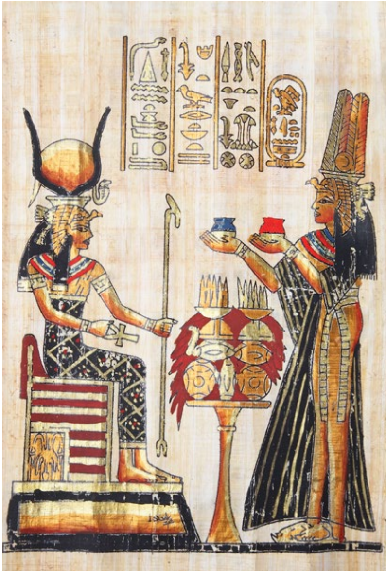
7. Egipska bogini Izyda z dyskiem słonecznym pomiędzy rogami