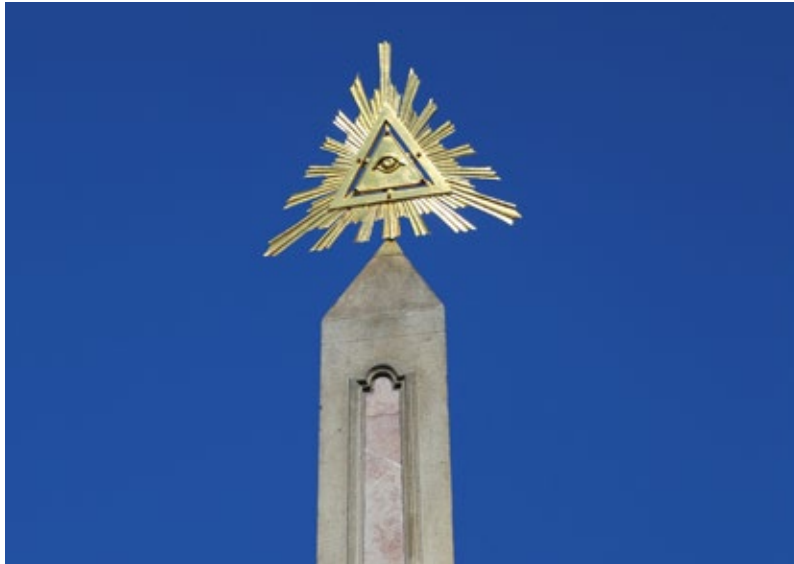
3. Wszechwidzące oko Horusa nad egipskim obeliskiem w powiązaniu z symboliką masońską