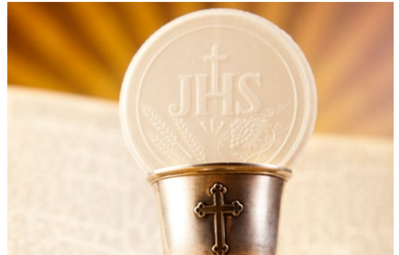
6. Emblemat IHS na hostii