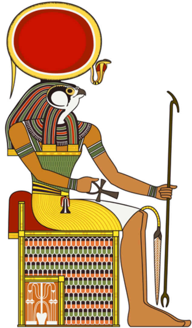
8. Egipski bóg nieba Horus z tarczą słońca na głowie